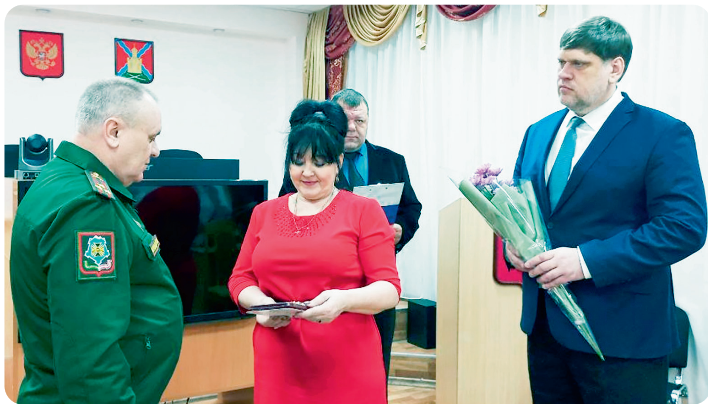
Семьям погибших солдат из Багаевского района вручили ордена Мужества - стр. 3

Общественно-политическая газета Багаевского района. Основана в августе 1933 года № 48 (11072) 19 декабря 2025 г.