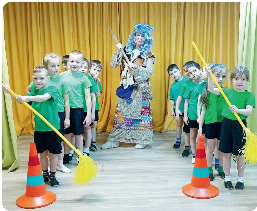
Зимние забавы в детском саду - стр. 7