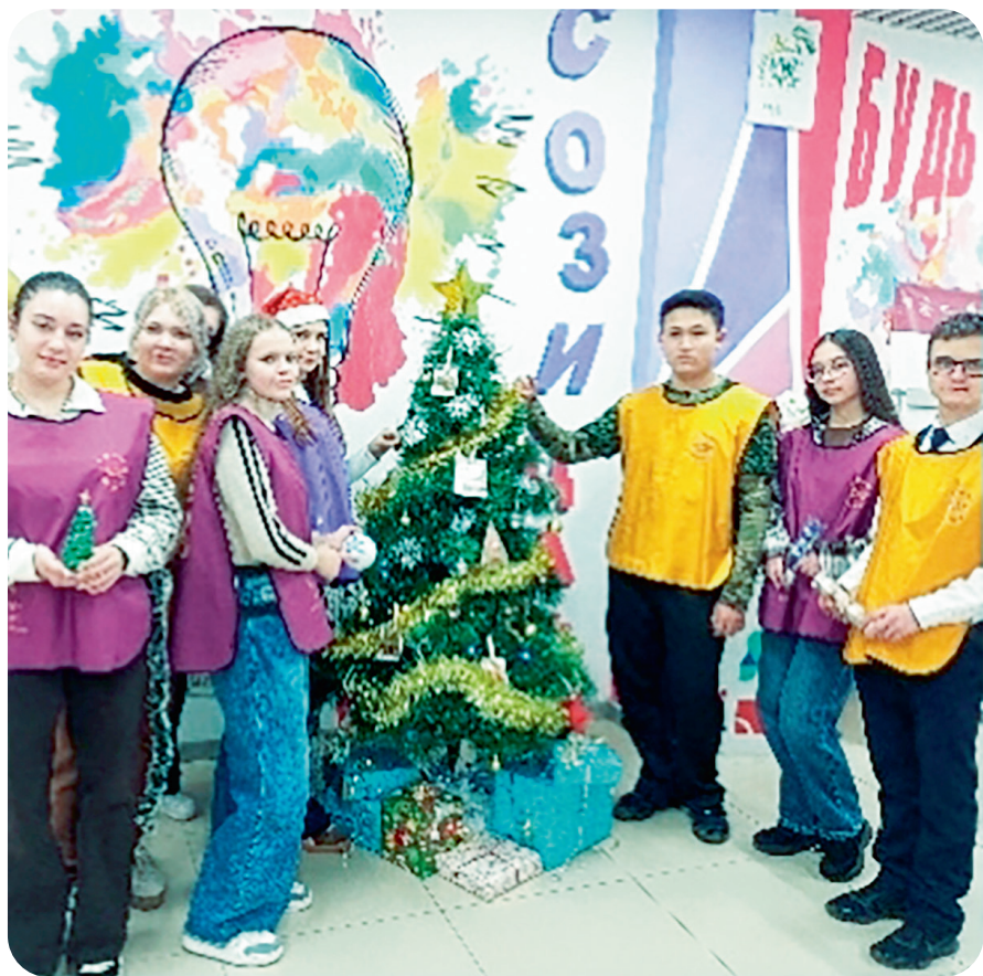
Готовимся к Новому году - стр. 9